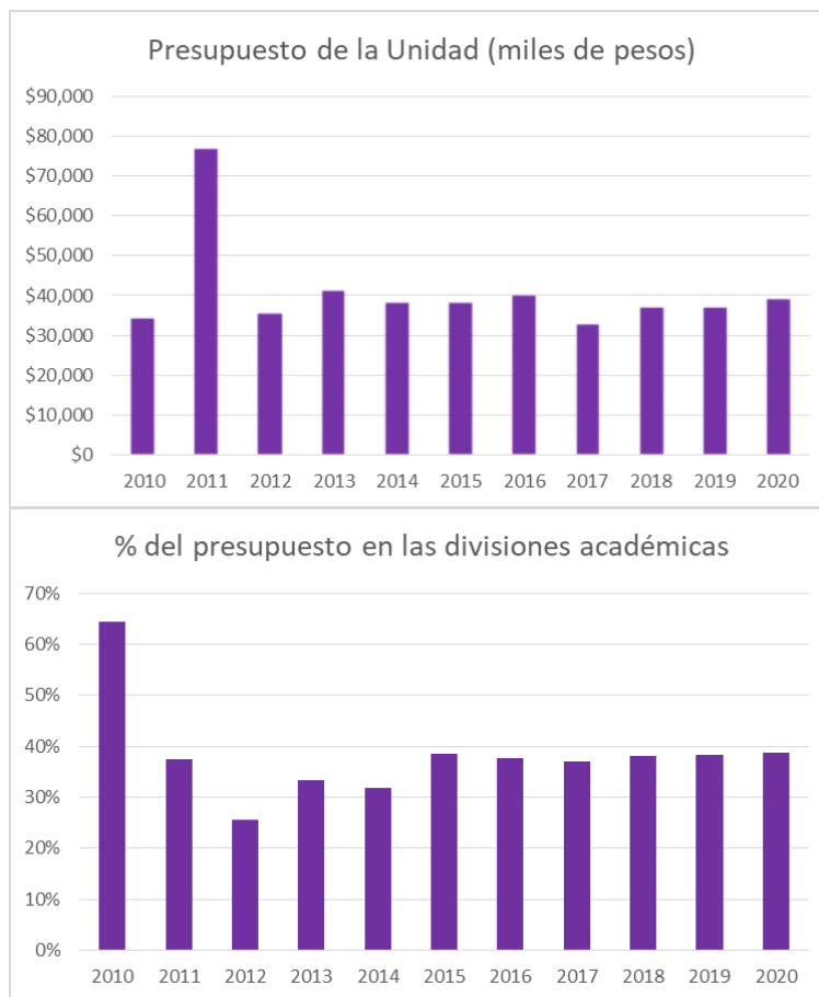
Tabla 1. Histórico de Techos Presupuestales en la Unidad Lerma 2010-2020 (miles de pesos)

Fuente: Elaborado con base en los presupuestos aprobados por el Consejo Académico UAM L, 2010-2019