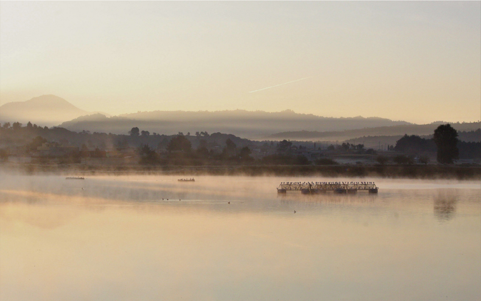
Amanecer sobre lienzo (2021)